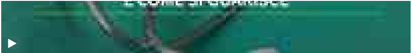
La tonsillite di Sinner, così frequente fra i bimbi