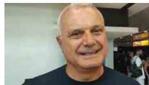
Parigi 2024, Campagna: "Il Settebello merita le tante aspettative"