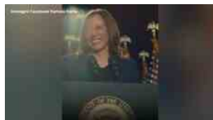
Harris lancia il primo spot elettorale: "Scegli la libertà"