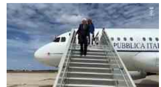
Mattarella arrivato a Parigi per l'apertura delle Olimpiadi