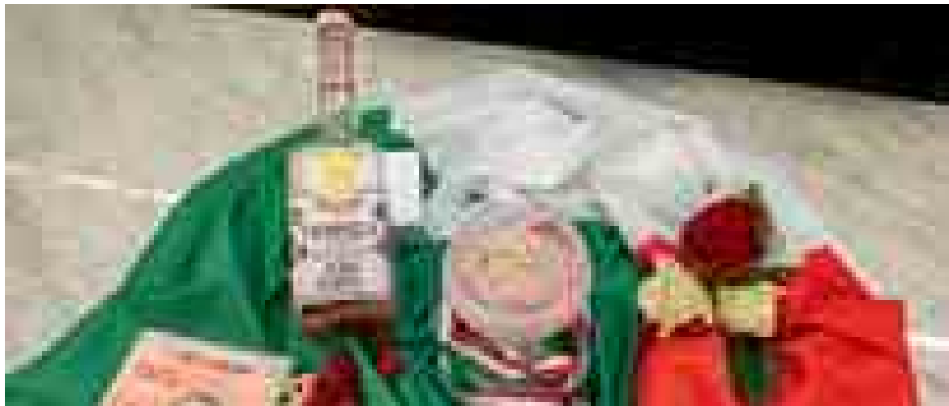
A Firenze un gelato celebra la prima donna a vincere l'oro olimpico