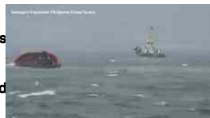
Petroliera affonda nelle Filippine, 1,4 mln di litri in mare