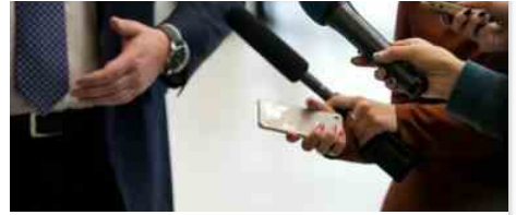
Il lavoro dei giornalisti: tra Verità e pubblico dei tifosi

di fare quello che ti ho chiesto di fare, che penso sia proprio di un paese civile dove la pubblica amministrazione è a servizio delle imprese, dei cittadini e non il contrario", ha aggiunto Salvini. "Conto che rimettere sul mercato, non alcune migliaia, ma secondo la stima dell'ordine degli ingegneri, alcuni milioni di abitazioni che oggi non potevano starci per piccole imperfezioni, irregolarità o difformità , la doppia conformità e amenità solo italiane, possa rialimentare il settore dell'immobiliare, che certo poi a Roma ha anche la burocrazia comunale non sempre a disposizione, però penso che sia un buon viatico".